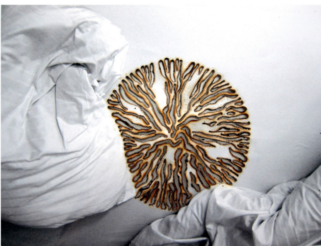
Regina Basaran: „Verlassen 1, 2 und 3“, (von oben nach unten)