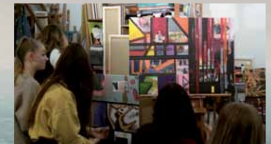
Atelierbesuch bei Ariane Sibyll Keller

Für Schulklassen besteht die Möglichkeit der Führung unter der Woche. Anmeldung unter Tel. 0151 2063 2057