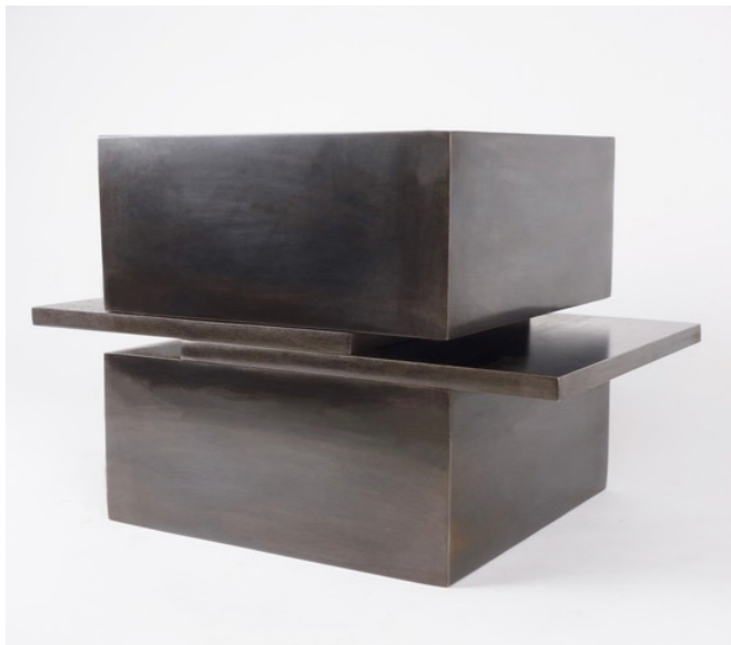
Stephan Siebers Skulptur: LAYERING II, 2020, patinierter Stahl, 50 x 30 x 32 cm